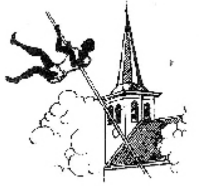
Het logo van de afdeling Winsum.

Voor de in 1984 opgerichte stichting betekent dat een flinke kostenpost, weet de voorzitter. „Je bent natuurlijk nooit klaar. Maar in mijn ogen moeten we de limiet van de polis in ieder geval houden zoals die nu is. En dan kunnen we in Winsum voorlopig nog wel even vooruit.”